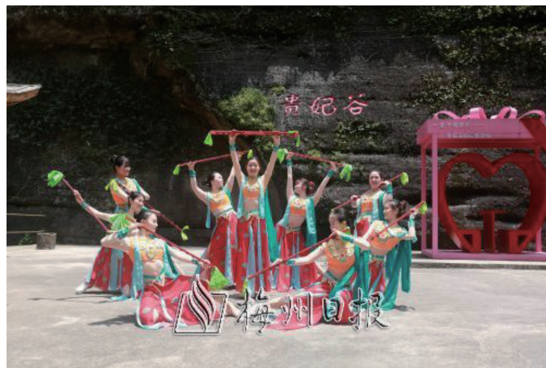
市級非遺項目“落地金錢”舞蹈在五指石景區表演。